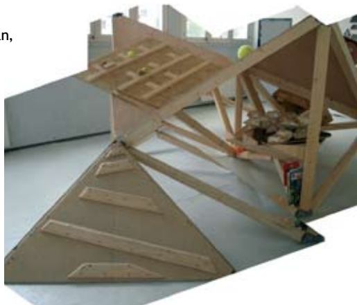
Ernesto Sartori Table de découpe

JEAN-CHRISTOPHE BAILLY, écrivain et enseignant à l'École nationale supérieure de la nature et du paysage à Blois, le jeudi 19 juin à 18h18 .