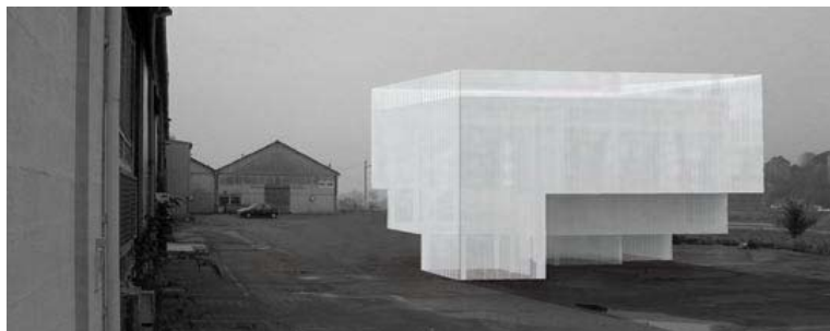
Open climate, implantation du pavillon de 92m2 sur l'île de Nantes. Projet : 2006.