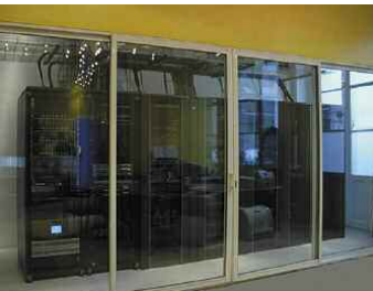
La mémoire informatique de l'ENSBA.

Cette communication a pour ambition de présenter la génération artistique née avant la Grande Guerre, formée entre classicisme et avant-garde. En nous appuyant sur des exemples de trajectoires d'artistes, peintres et sculpteurs, nous présenterons la figure de l'artiste indépendant durant l'entre-deux-guerres. Des artistes tels que André Lhote, Marcel Gromaire, Ossip Zadkine ou Fernand Léger ont conjugué les apports du classicisme et de la modernité héritée des premières avant-gardes fauves et cubistes. D'instruits, ils devinrent parfois enseignants et offrirent une nouvelle voie de formation, en parallèle d'une École des Beaux-Arts devenue moribonde. En montrant la perméabilité et la complexité de l'enseignement de l'art moderne et de l'art officiel à cette époque, nous dresserons un panorama des lieux de formation, et ouvrirons sur la question des ateliers libres qui ont formé les premières générations de peintres abstraits, tels que Aurélie Nemours.