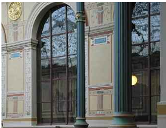
École Nationale Supérieure des Beaux-Arts de Paris : détail de la cour vitrée du palais des études.