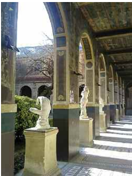
L'École des Beaux-Arts. La cour du mûrier.

À la fin des années 1960 et au début des années 1970, la création d'un enseignement universitaire dédié aux arts plastiques advient dans un contexte social et intellectuel fortement marqué par une aspiration collective à la créativité. Elle fait également écho à une remise en question des formes traditionnelles de la transmission du savoir historique sur l'art. Ces circonstances sont particulièrement prégnantes dans la création, à la même époque, des concours destinés à recruter les enseignants du secondaire (le capes) en 1972 et l'agrégation en 1975). Quatre décennies après, si l'enseignement d'arts plastiques est pleinement reconnu au plan institutionnel, tant au niveau scolaire qu'universitaire, les représentations dont il fait l'objet demeurent complexes. Par le biais d'une démarche historique et problématique, cette communication tentera d'évoquer les tensions qui, dans cet enseignement, caractérisent la cohabitation dans les institutions éducatives entre la transmission d'un savoir pratique et celle d'un savoir théorique et historique sur l'art.