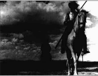
1. Don Quichotte, Orson Welles, 1955-1973.