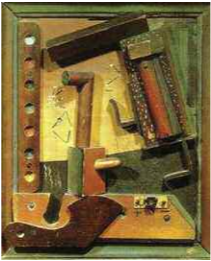
5. Max Ernst, Fruit d'une longue expérience , 1919. Coll. privée.