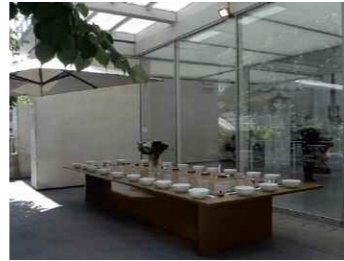
6. Sarkis, Atelier d'aquarelle dans l'eau , 2010. © Sarkis.