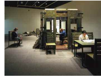
7. Siah Armajani, Sacco and Vanzetti Reading Room 2, List Gallery, Massachusetts Institute of Technology, Cambridge, 1987-1988.