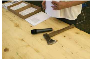
10. Pierre Joseph, École de Stéphanie, Utopics , Bienne, 2009. © Pierre Joseph.