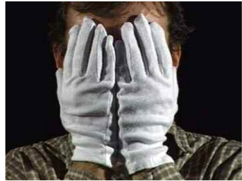
9. Érik Bullot, Glossolalie . © Érik Bullot.