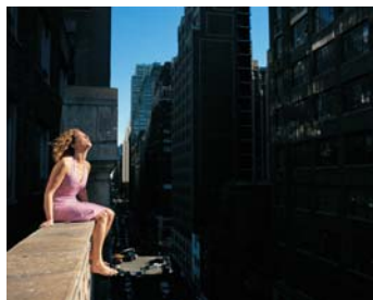
© Laurent Montaron, Spit , 2004.

Laurent Montaron a participé à l'exposition Subréel au MAC de Marseille et a présenté ses derniers travaux à La Galerie de Noisy-le-Sec en janvier 2006.